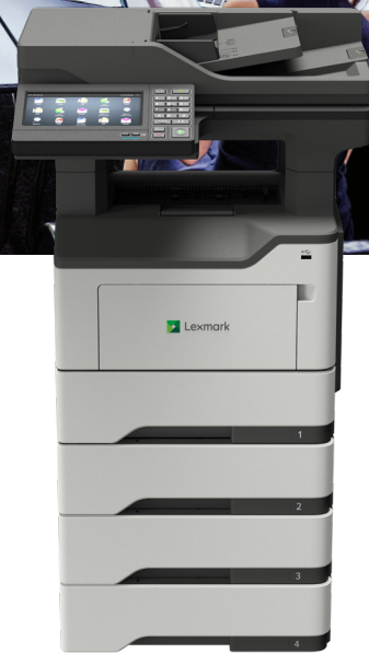
MB2650adwe mit optionalen Fächern