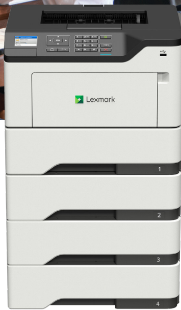
B2650dw mit optionalen Fächern